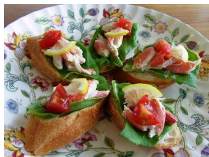
サラダ・サンドイッチ